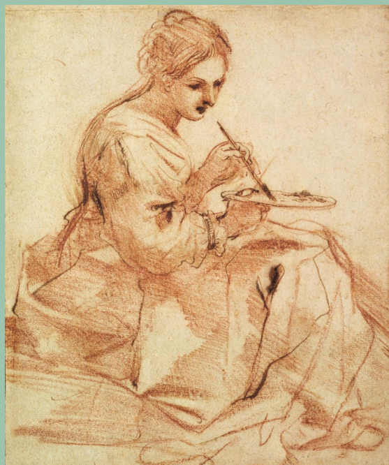
Il Guercino, Una donna che dipinge

SERVIZIO SANITARIO REGIONALE EMILIA-ROMAGNA Azienda Unità Sanitaria Locale di Ferrara